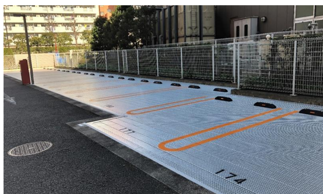
(屋外スマートデッキ)